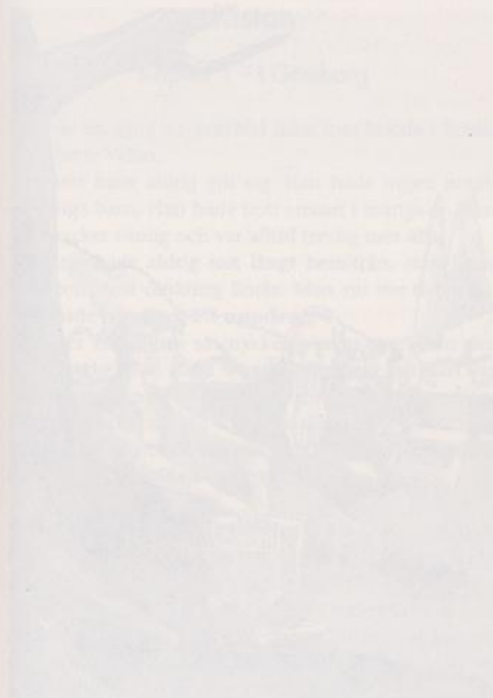
Klockan. Det var omkring år 1500 som klockan tillkom. Den var gjuten i 25 delar. Man kan se att den är gjuten i ett stycke. Den är gjuten i ett stycke. Den är gjuten i ett stycke.